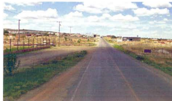
Zona Metropolitana Zac. – Gpe.

Localización: Zona Metropolitana Zacatecas-Guadalupe